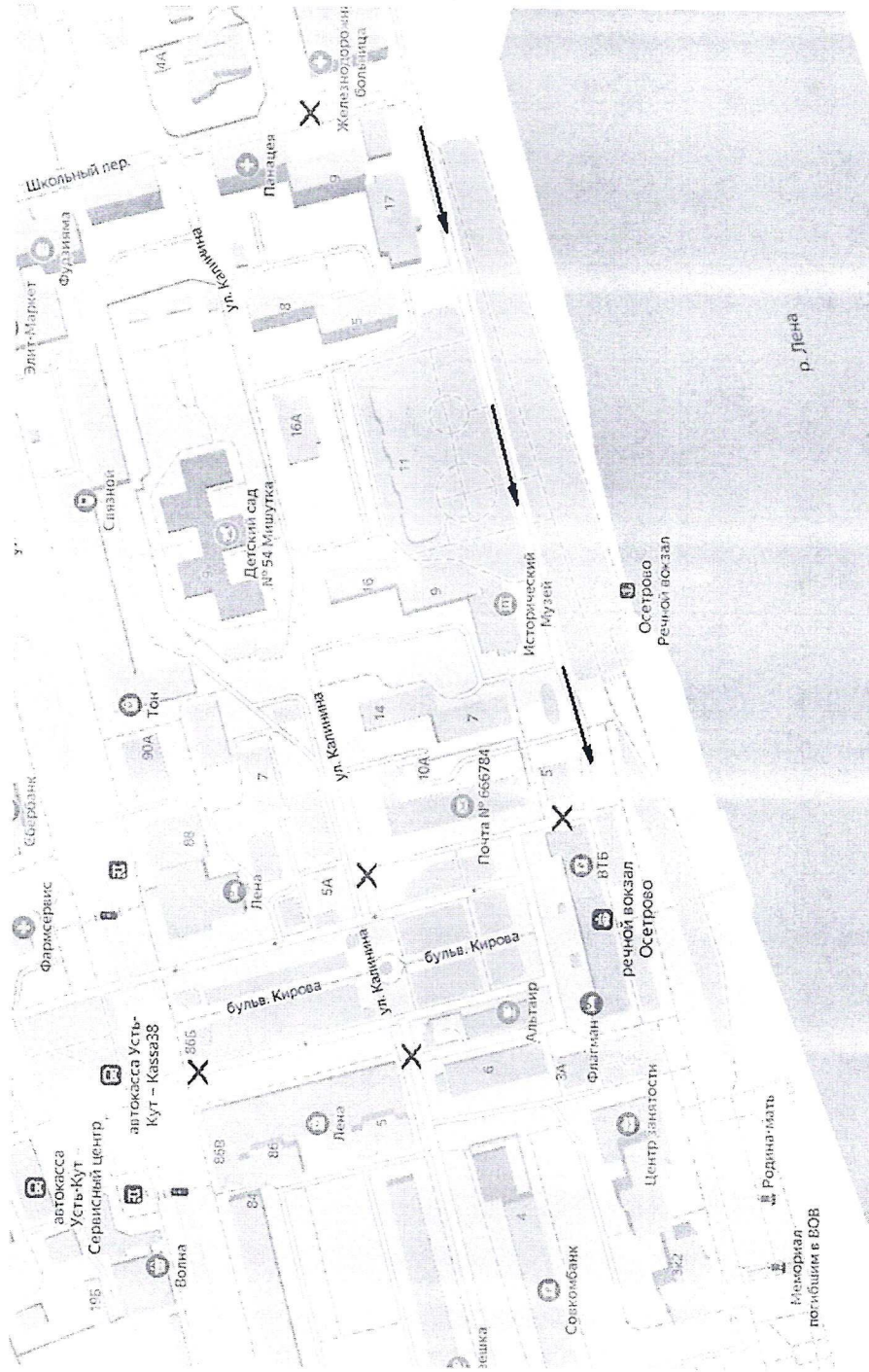
Схема ограничения дорожного движения во время проведения Парада Победы и выездной торговли

Условные обозначения: X - посты блокирования дорожного движения