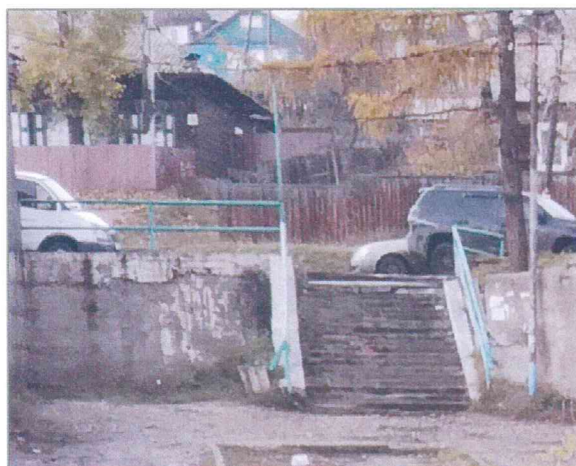
В настоящее время - до благоустройства